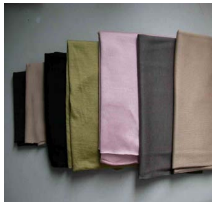
“酶法脱鳞”技术处理的发制品 酶复合助剂整理技术处理的面料