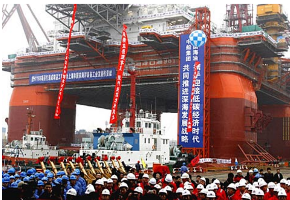
3000 米深水半潜式钻井平台建成出坞

技术体系并应用于我国第一个深水工程试验水池，具备 4000 米水深的深海工程模拟试验能力，使我国深水工程试验技术达到国际先进行列，在国际上排名仅次于荷兰 MARIN 水池，实现了我国深水工程试验技术从零到世界前列的重大跨越；突破并形成了 3000 米半潜式钻井平台设计建造的 10 项关键技术，成功应用于第六代深水半潜式钻井平台-海洋石油 981 半潜式钻井平台建造，使我国具备了深水半潜式钻井平台的自主设计制造能力；研制了钻井中途测试仪并成功实现工程化，已应用于国内海洋油气勘探开发以及国外工程承包。深水高精度地震勘探系统、深水铺管装备、深水重型防喷器和隔水管系统等重大装备研制取得突破性进展。