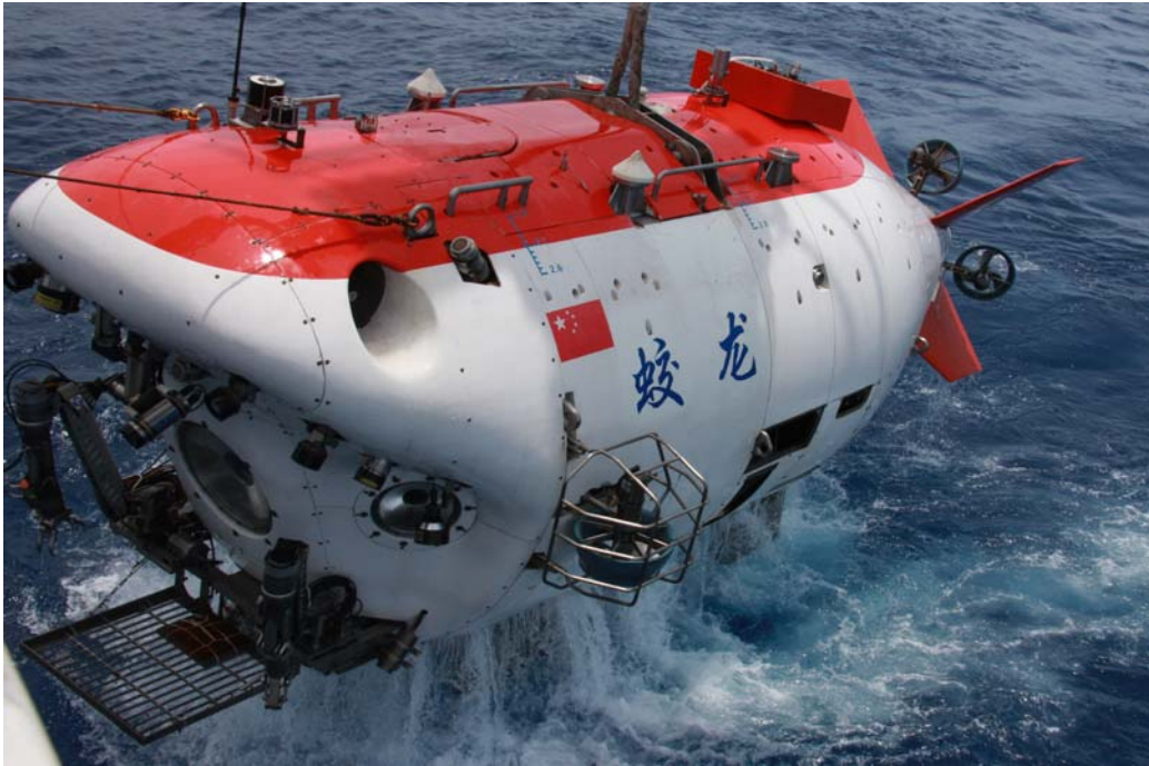
图 1：“蛟龙号”载人潜水器